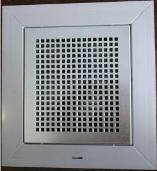
Ansicht von außen – Ungezieferschutzgitter in der „Lichten“ des Rahmens (Öffnung des Rahmens)

Das Ungezieferschutzgitter wird nach oben, unten, rechts und links mit je 2 Edelstahlschrauben in den Rahmen des Fensters verschraubt. Die Verschraubung erfolgt in mindestens 2 Kammern des Rahmens.