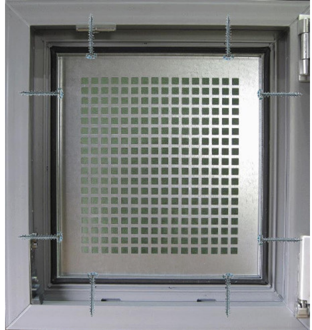
Ansicht von innen (Die Schrauben sind nur schematisch dargestellt und nicht sichtbar!)